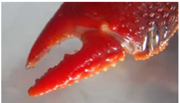
Nốt sần trên càng