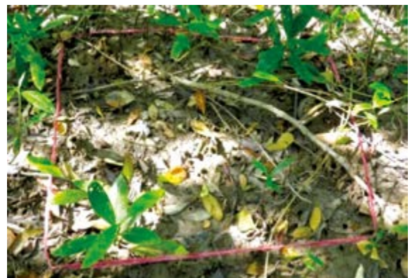
Hình 3. Ô thu mẫu.