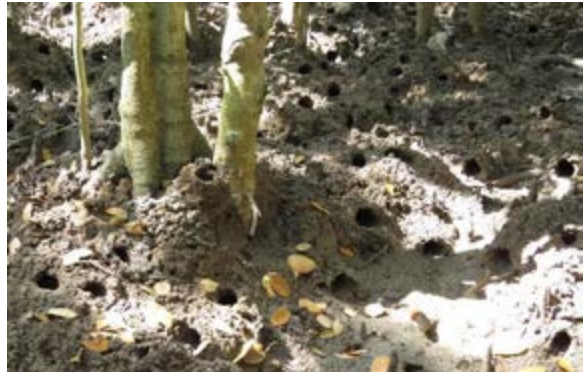
(A) Sinh cảnh 3