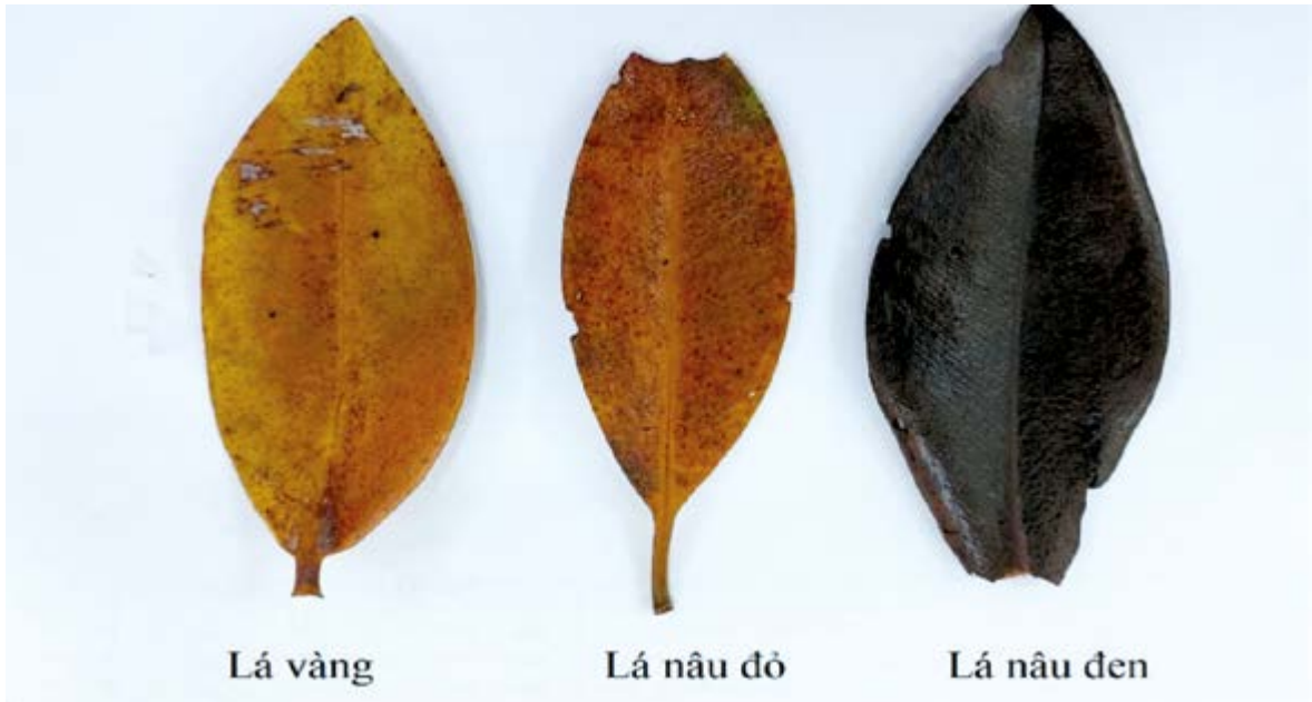
Hình 1. Các loại lá dùng trong thí nghiệm.

thí nghiệm thức và 5 lần lặp lại. Mỗi thí nghiệm thức gồm 5 con còng và 1 loại lá. Trong đó: NT1: 5 còng lớn + lá vàng; NT2: 5 còng lớn + lá nâu đỏ; NT3: 5 còng lớn + lá nâu đen; NT4: 5 còng nhỏ + lá vàng; NT5: 5 còng nhỏ + lá nâu đỏ; NT6: 5 còng nhỏ + lá nâu đen.